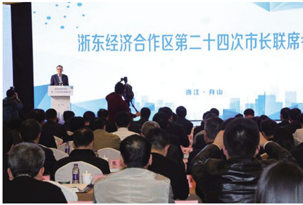
东五市应急管理区域合作交流协议》,通过了《关于外经贸专业组和商贸专业组合并为商务专业组的提案》。

浙东经济合作区是甬、绍、舟、台、嘉五市自愿组合的区域经济合作组织,是全国成立最早、目前最具活力的经济合作区之一,为推动浙东五市经济发展作出了积极贡献。本次会议审议并通过了浙东经济合作区市长联席会议工作报告,会议期间还签署了《浙