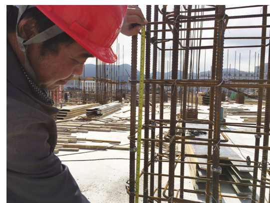
施工人员在实测实量

严格把控质量关卡。 工程的质量是评判一家建筑施工企业优秀与否的根本标准,水产品交易市场(一期)工程项目部为了确保工程质量,提升公司品牌形象,对工程质量进行严格把控。项目部组织施工科、质量科人员成立检查小组,不定期对施工现场进行实测实量。在以往的传统理念中,实测实量一直被认为是为了应付检查的形式主义,正是因为存在这种错误认识,导致后期在实测实量制度的落实上大打折扣。水产品交易市场(一期)工程项目部致力于严格落实实测实量制度,在第一时间获取实测实量数据,通过对数据的分析,及时找出问题的症结所在,针对性的采取措施。检查小组对每一道工序、每一次工种交接以及隐蔽工程验收进行严格检验,每一阶段的施工只有达到国家标准甚至超过国家标准要求,才能进行下一道工序。同时,项目部还设立了相应的奖罚机制,根据实测实量的检查情况,及时奖励、及时惩罚,营造积极的施工氛围,形成各班组成员你追我赶的良好局面。