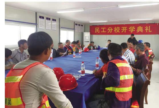
开展安全施工学习教育

从优选择施工班组。 施工班组质量好坏直接关系到工程施工的质量、进度和安全。由于水产品交易市场(一期)工程项目以曲线型设计为主,其中建筑的施工放样、模板安装、钢筋绑扎、幕墙安装等方面的技术要求较为复杂,所以项目部在班组的选择上更为严谨。首先优先选择有过类似工程施工经验的班组,对各施工班组实行针对技术经验、技术人员水平、工程承揽经验等条件进行考核,并对各施工班组施工过的其他工地进行实地考察,从中选出各工种中最优秀的班组签订合同。然后,针对水产品交易市场(一期)工程项目中所存在的技术难点组织班组进行培训。在定期召开的项目部会议上,对各班组提出施工要求,也让各班组长汇报施工情况,提出难点,以及安排计划。项目部安排施工员做好定点定人对接工作,收集每日施工各类情况,加班加点进行解决调整,及时回复给班组成员,克服施工困难,不断提高各班组成员解决问题的能力。