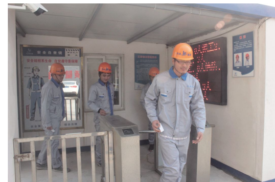
施工人员上班打卡

严格落实人员管理制度。 为加强人员管理,水产品交易市场(一期)工程项目部向所有施工人员发放门禁卡,并进行实名登记,卡中有持卡人的身份证信息、联系电话以及银行卡号,并录入电脑系统中,实行上下班打卡制度。为确保此项制度的实施,工地还采取全封闭围挡施工,与外界隔绝,并且设立门卫管理制度,杜绝施工人员相互代刷行为的发生。此外,施工人员实名制登记的实施,有效地帮助了项目部掌握每个班组参与施工的人员具体信息,确保每个施工人工工资发放到位,切实维护农民工权益。同时项目部还在工地门口设立农民工维权公告牌,积极帮助农民工进行维权,避免因工资拖欠等权益问题而发生群体性事件,有利于维护施工现场的稳定,以更好地开展项目施工,确保项目质量和进度,也充分体现公司项目部贯彻落实定海区建筑业开展的“定海无欠薪”行动的精神,积极履行企业的社会责任。